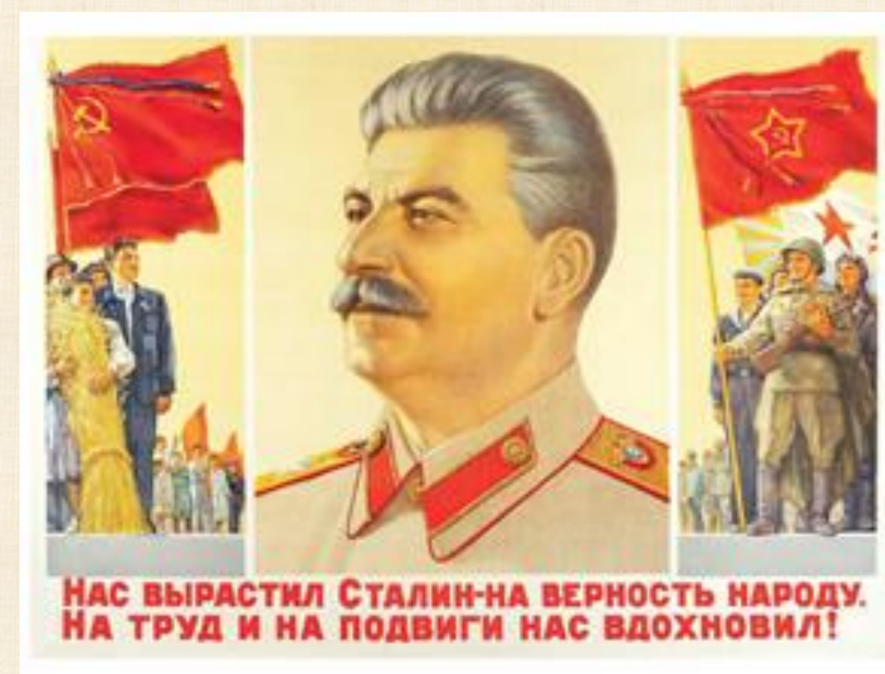
Iturria: Pich, 2016:277