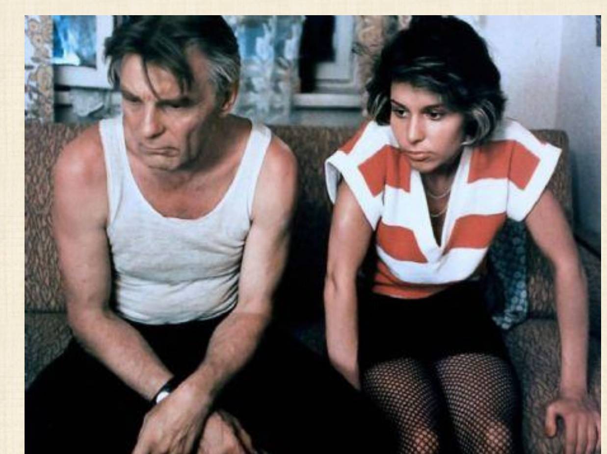
Little Vera filmeko irudia.