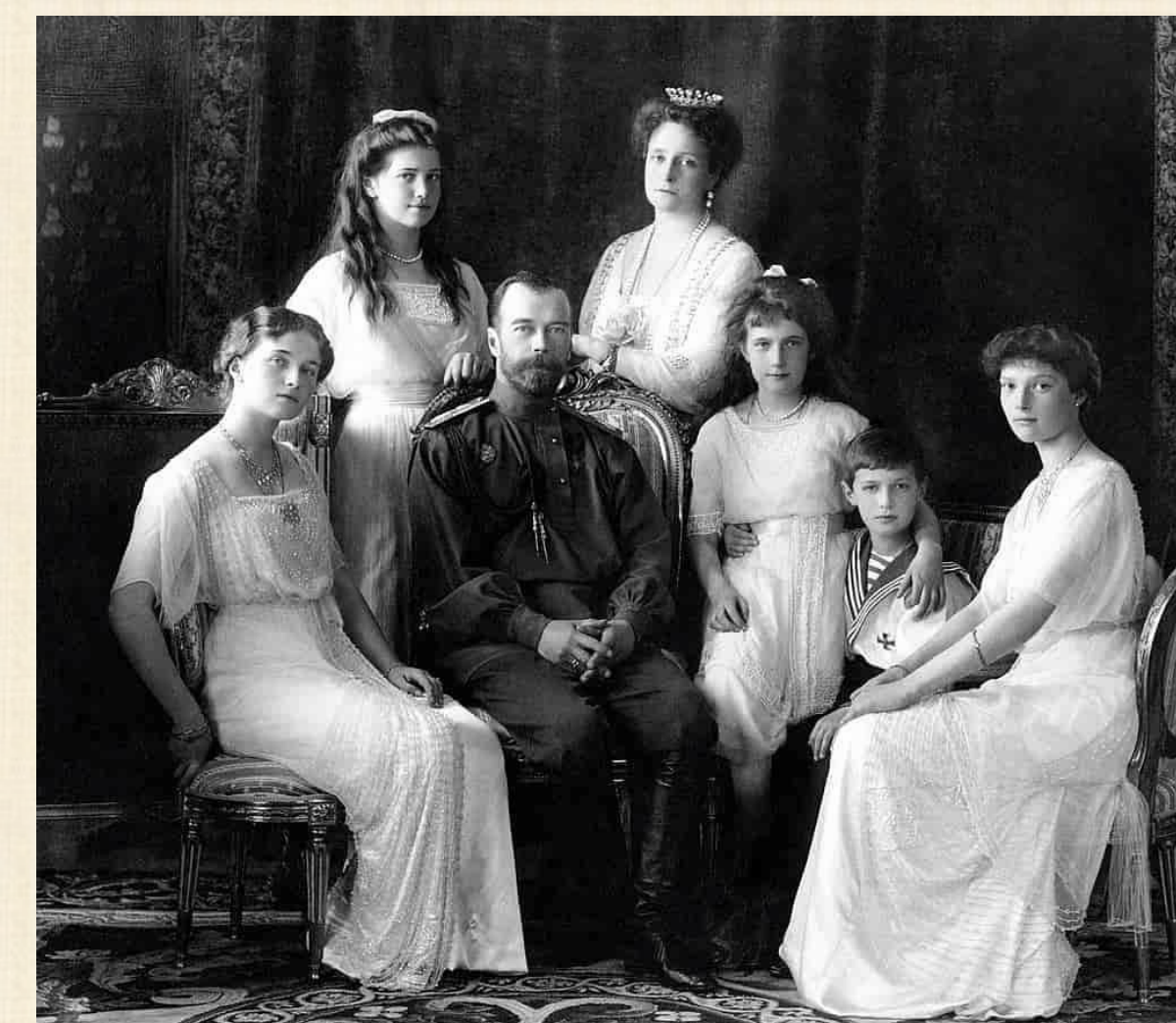
Nicolas II. Tsarra bere familiarekin.